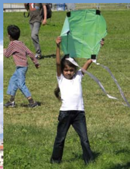
In der Woche konnten Schulkinder Drachen bauen und steigen lassen