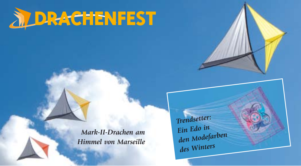
Mark-II-Drachen am Himmel von Marseille

Trendsetter: Ein Edo in den Modifarben des Winters