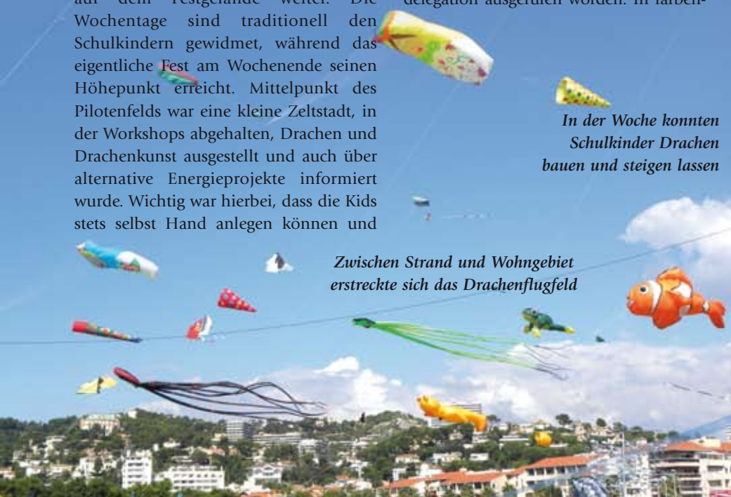
Zwischen Strand und Wohngebiet erstreckte sich das Drachenflugfeld

Zum Wochenende hin besserte sich schließlich das Wetter. Gewitter zogen nur noch nachts über die Stadt und verschonten tagsüber größtenteils die Drachenflieger. Jetzt endlich wurden die Schätze aus den Drachentaschen gepackt und in den Himmel steigen gelassen. Das Flugfeld lag direkt am Mittelmeer auf