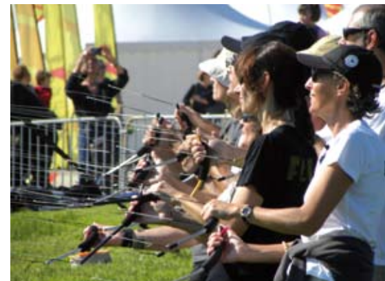
Das Megateam Revolution bewegte gleich zehn Lenkdrachen synchron