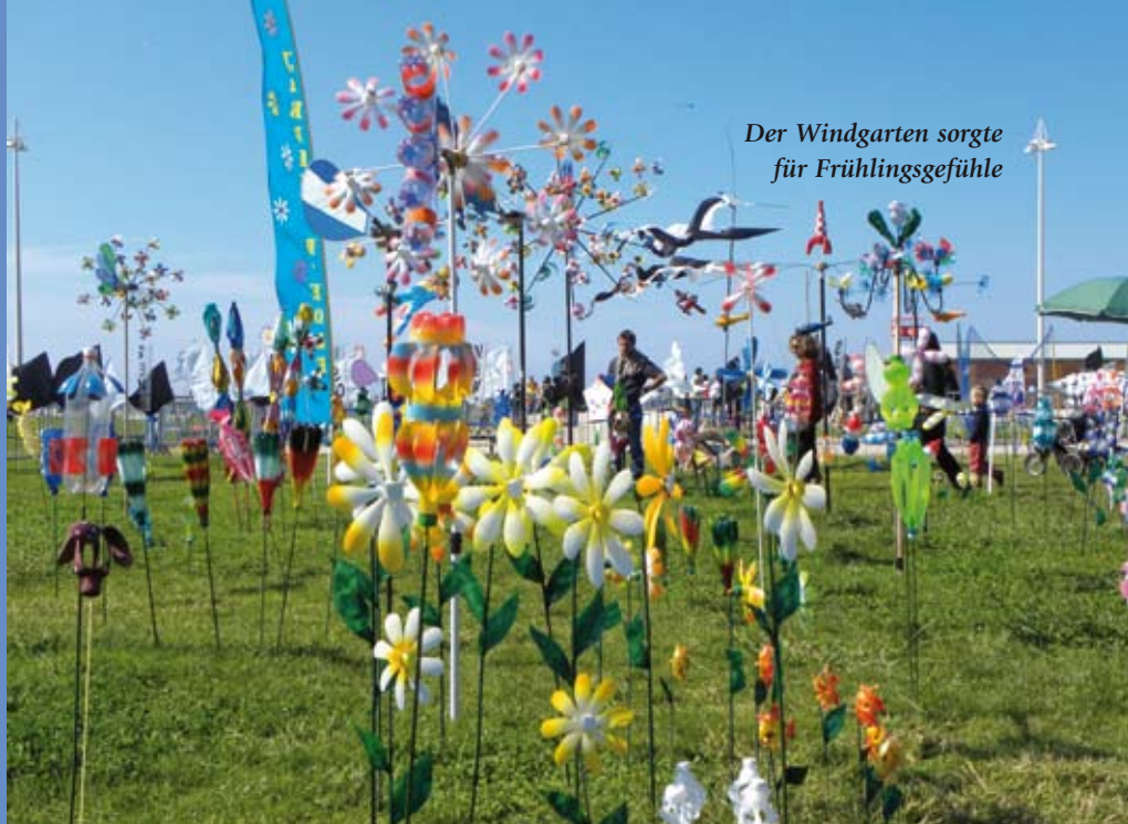
Der Windgarten sorgte für Frühlingsgefühle

Während sich die Drachenflieger also zwangsweise in der Stadt anderweitig beschäftigten, ging das Rahmenprogramm auf dem Festgelände weiter. Die Wochentage sind traditionell den Schulkindern gewidmet, während das eigentliche Fest am Wochenende seinen Höhepunkt erreicht. Mittelpunkt des Pilotenfelds war eine kleine Zeltstadt, in der Workshops abgehalten, Drachen und Drachenkunst ausgestellt und auch über alternative Energieprojekte informiert wurde. Wichtig war hierbei, dass die Kids stets selbst Hand anlegen können und