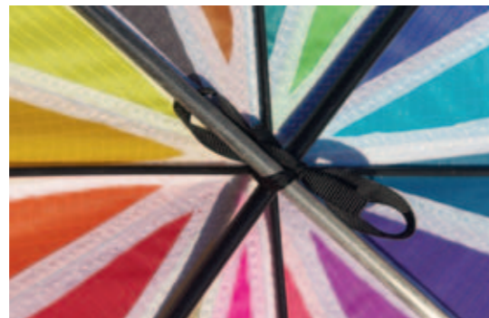
Eine mittige Schleife zentriert die Stäbe