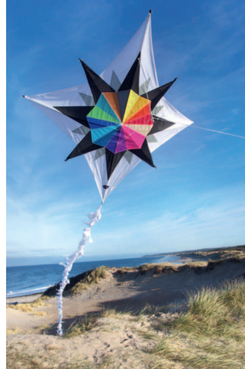
Mit seiner Sternform und der auffälligen Farbgebung beeindruckt der Large Enif