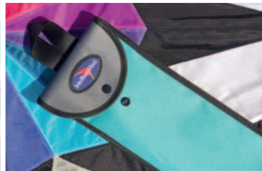
Solider, optisch ansprechender Köcher