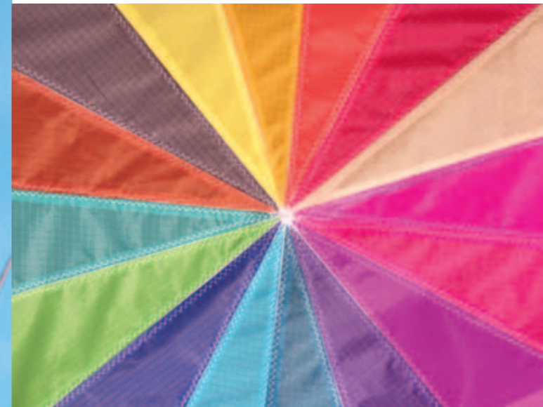
Die bunte Farbpalette der rosettenförmig angeordneten 16 Mittelpaneele