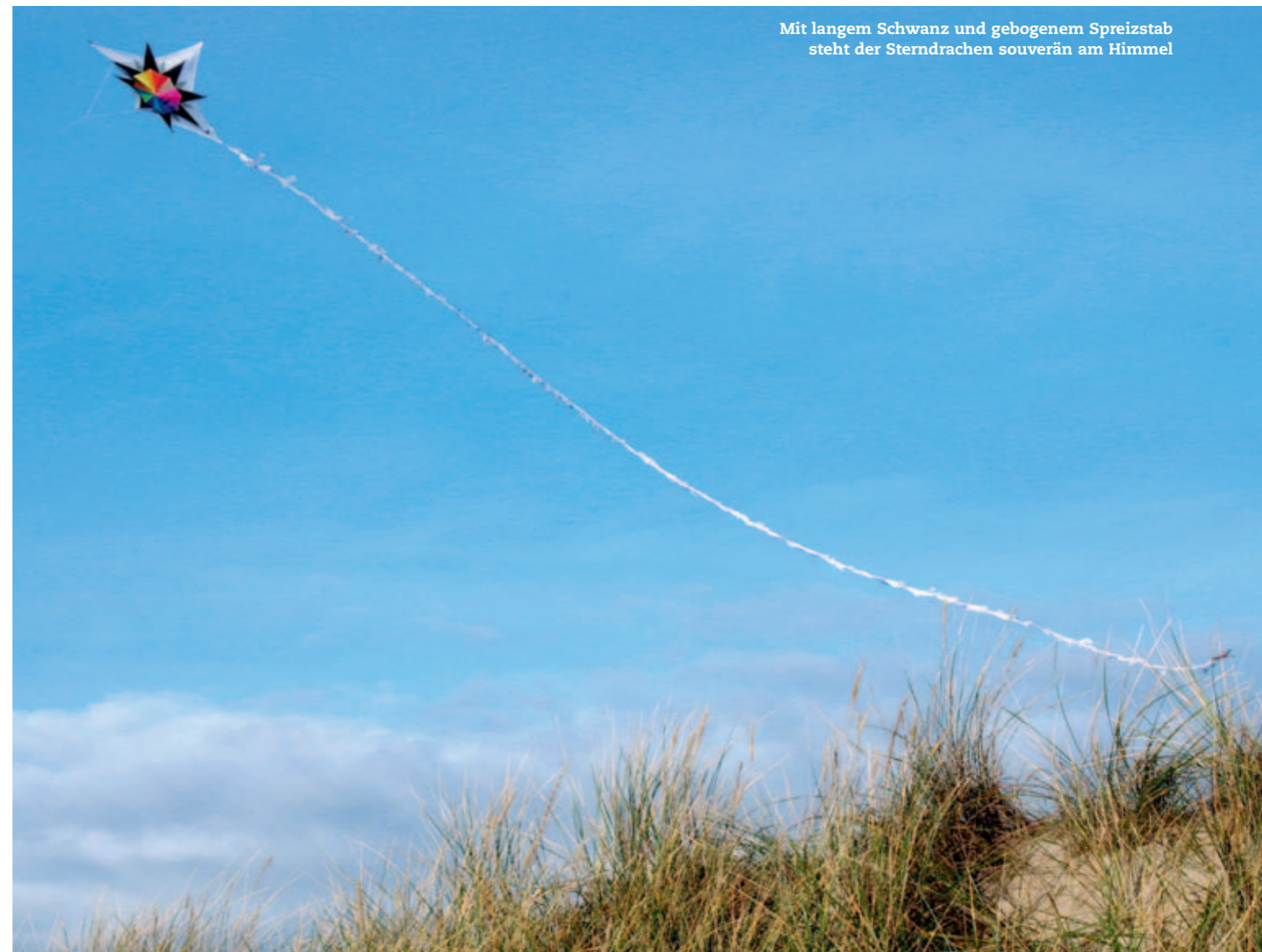
Mit langem Schwanz und gebogenem Spreizstab steht der Sterndrachen souverän am Himmel

Ihre persönlichen Daten werden ausschließlich verlagsintern und zu Ihrer Information genutzt. Es erfolgt keine Weitergabe an Dritte. Sie können der Verarbeitung oder Nutzung Ihrer Daten unter der hier aufgeführten Adresse widersprechen.